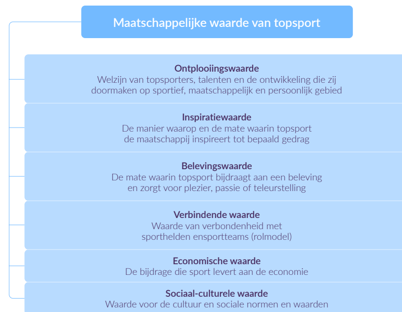
Figuur 1. Omschrijving van maatschappelijke waarde van topsport

manieren om deze in te delen. We hebben deze kennis samengevoegd en stellen voor om uit te gaan van zes maatschappelijke waarden: de ontplooiingswaarde, inspiratiewaarde, belevingswaarde, verbindende waarde, economische waarde en sociaal-culturele waarde (zie figuur 1). Deze waarden zijn van betekenis voor de maatschappij omdat zij (positieve of negatieve) invloeden en effecten kunnen hebben op de samenleving. Bij het overzicht van de huidige kennis op het gebied van maatschappelijke waarde van topsport houden we deze onderverdeling aan.